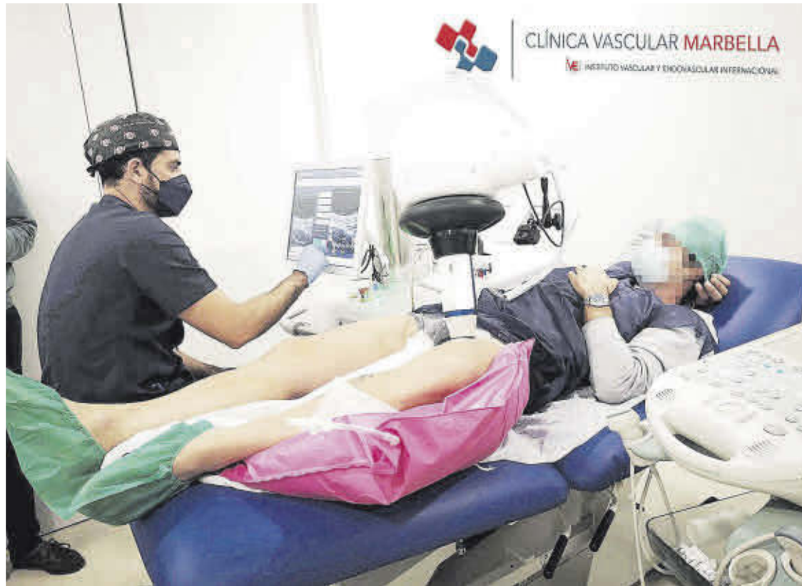
La clínica vascular Marbella aplica el sistema SONOVEIN en el tratamiento de las varices.

IVEI, con un bagaje de excelencia de casi una década en el campo de la cirugía vascular y endovascular, se ha convertido en referencia nacional e internacional para atraer tecnologías innovadoras y punteras en el ámbito de la especialidad. En estos momentos se trata de la única institución en España, junto al Hospital Universitario HM Montepíncipe de Madrid, que cuenta con la tecnología de vanguardia capaz de eliminar el síndrome varicoso, las temidas varices, a través de un sistema no